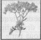
Rutine (ruta graveolens)