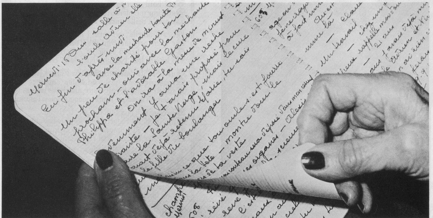
« Je copie, je copie, je remplis des cahiers d'écolier... »