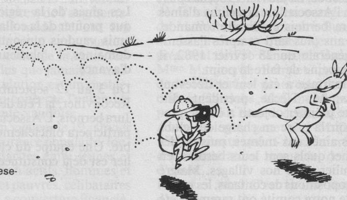
Sans paroles (Dessin de Moese-Cosmopress)

Inscriptions jusqu'au 10 mai 1982 à: Pro Senectute, rue des Tonneliers 7, 1950 Sion, tél. (027) 22 07 41. (L'inscription est définitive au moment du paiement au ccp 19-361, Pro Senectute Sion.) Sont admises à ce séjour les personnes âgées de 55 ans et plus. Carte d'identité valable ou passeport périmé depuis moins de cinq ans.