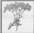
Rutine (ruta graveolens)