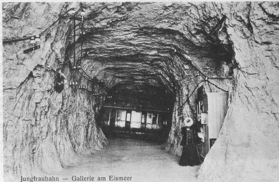
Jungfraubahn — Gallerie am Eismeer

(J.-P. Cuendet, rue de la Gare, 1162 Saint-Prex.)