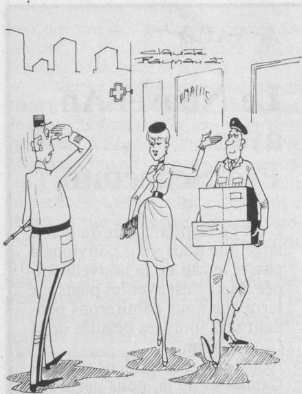
— Mes respects «son» capitaine! (Dessin de Raynaud-Cosmopress)