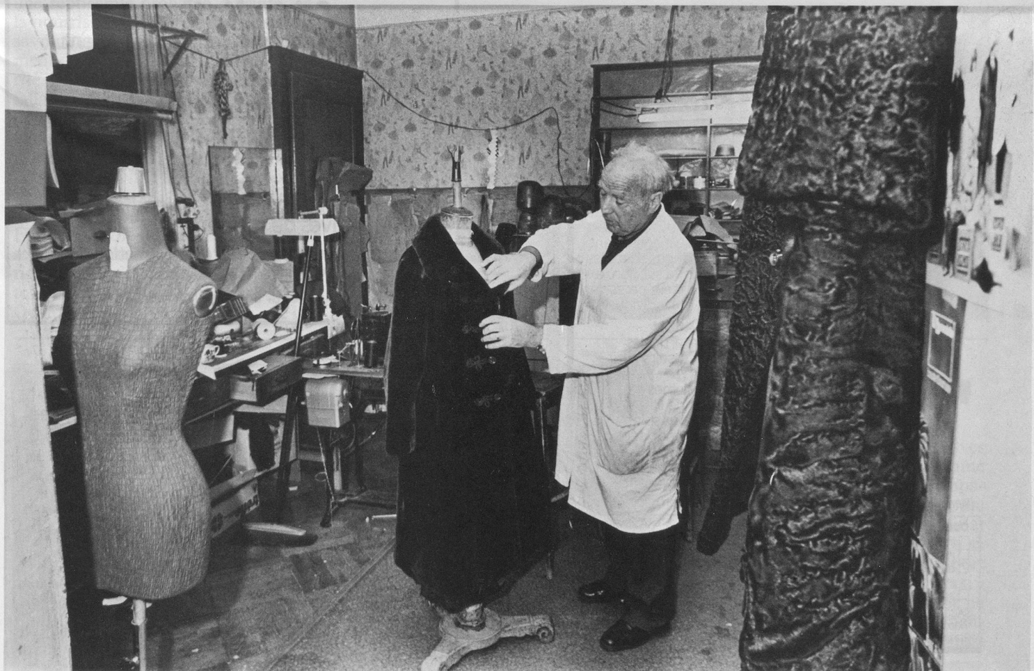
En hiver la fourrure, les inventions en été.