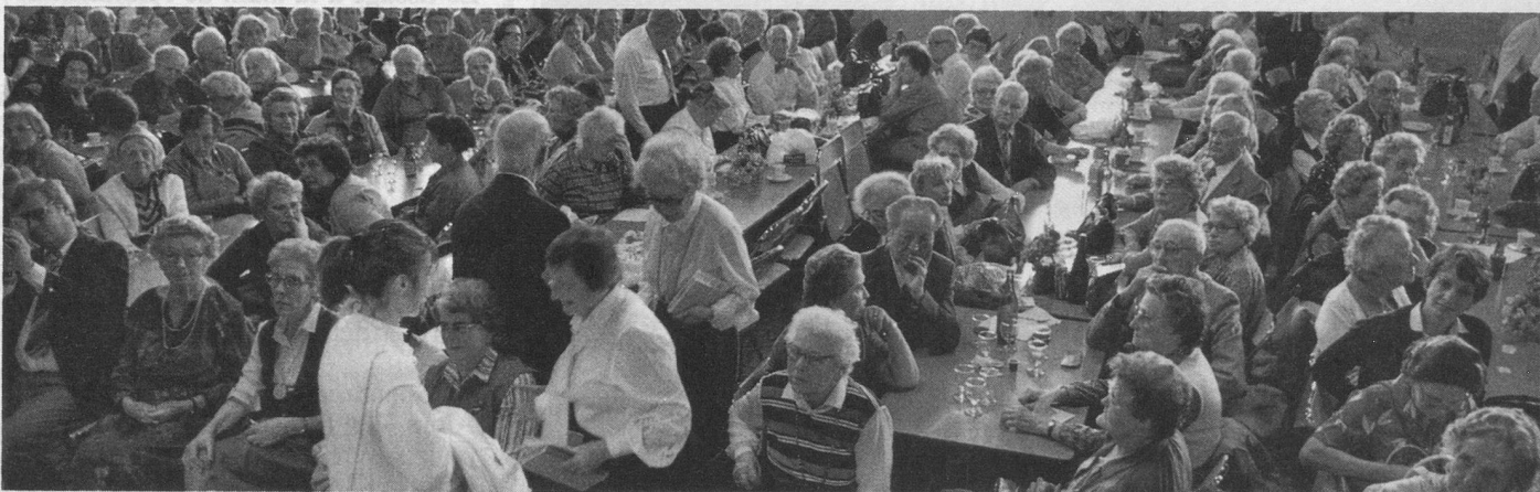
La foule attentive et enthousiaste des retraités réunis à l'occasion de ce 10 e anniversaire.

La partie officielle permit d'apprécier les messages du directeur de Pro Se-