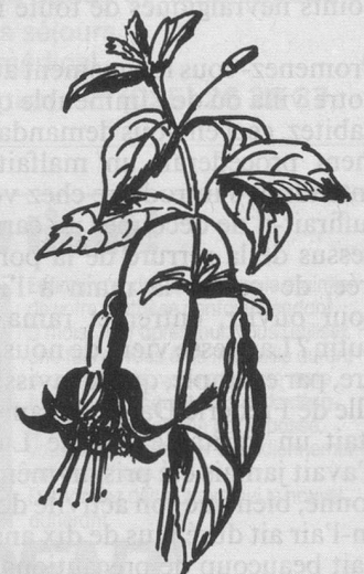
Fuchsias : rabattre les tiges à quelques centimètres.