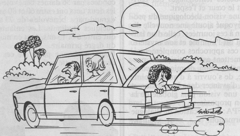
— Je t'ai dit plusieurs fois d'éviter d'emmener ta mère quand elle a mangé de l'ail... (Dessin de Ramon Sabatès)

En outre, pour la deuxième fois, Pro Senectute a organisé en septembre dans la région de Flims des vacances-excursions (en allemand Wanderferien). Gros succès et toute bonne expérience avec vingt-cinq participants(tes) et, comme de bien entendu, le traditionnel bilinguisme biennois. E. H.