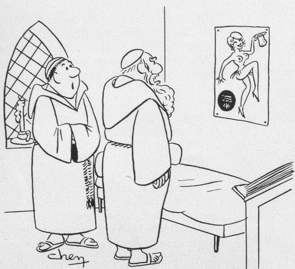
— Frère Jean dit que c'est sa nièce. (Dessin de Chen-Cosmopress)