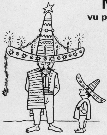
Noël en Amérique du Sud.