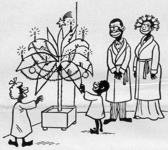
Noël en Afrique.