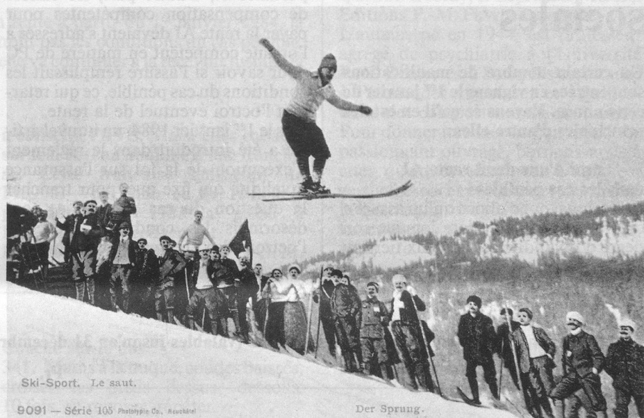
Ski-Sport. Le saut.

Alors, si vous songez à faire de l'ordre dans vos greniers, n'hésitez pas à demander mon aide, bien entendu gratuite. Et, à cette occasion, mêlant l'utile à l'agréable, je risque de trouver des cartes qui compléteront heureusement mes collections: j'en salive à l'avance! (J.-P. Cuendet, rue de la Gare, 1162 Saint-Prex).