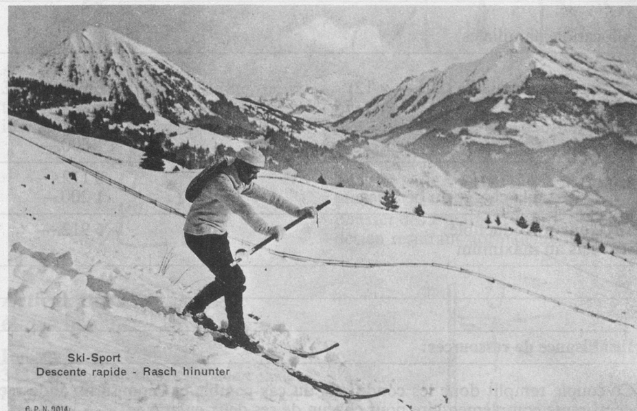
Ski-Sport Descente rapide - Rasch hinunter

Le bâton en mains était là pour permettre de freiner, entre les jambes, et de mieux terminer une majestueuse arabesque.