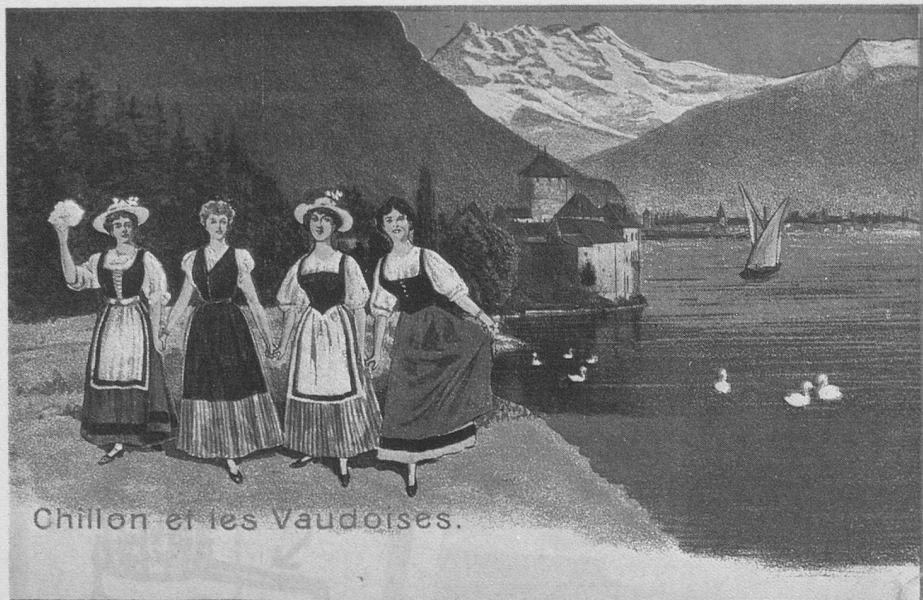
Chillon et les Vaudoises.