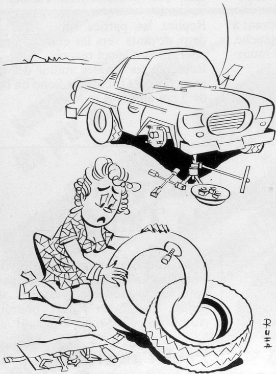
Sans paroles (Dessin de Facke-Cosmopress)