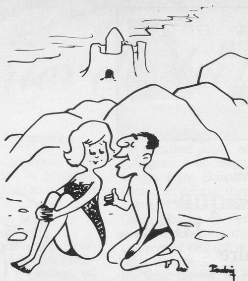
— Tout près d'ici, j'ai un château au bord de la mer! (Dessin de Padry-Cosmopress)