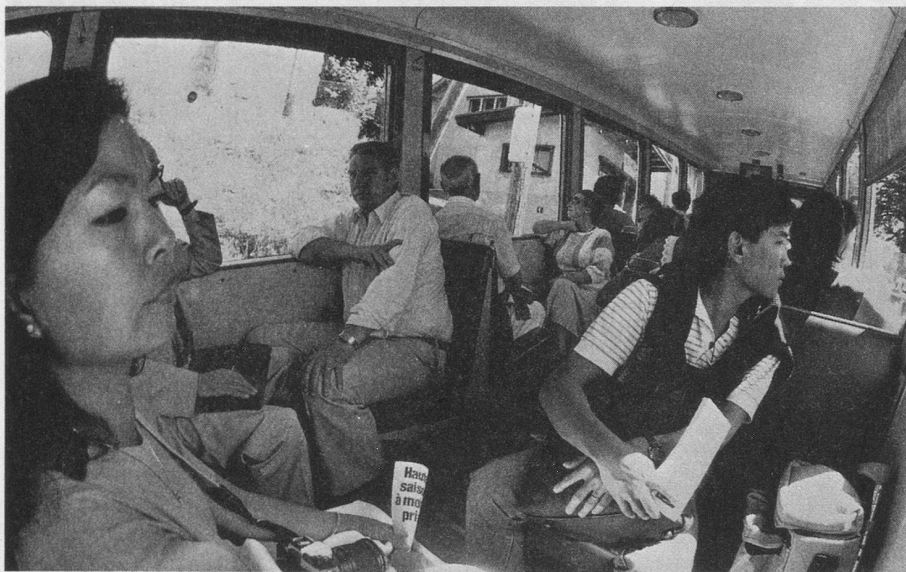
Des touristes du monde entier.

C'est cet ingénieur devenu grand patron du MOB qui a, entre autres, réalisé la télésurveillance et l'observation à distance de l'ensemble du réseau. Cette télésurveillance s'opère à la gare de Glion, aussi bien sur le Territet—Glion, le Montreux—Glion et le Glion—Naye. L'agent assumant la desserte de Glion contrôle directement de son bureau l'ensemble du réseau sur un écran de TV interne, ce qui lui permet de prendre sans délai et en connaissance de cause les décisions nécessaires pour faire face à n'importe quelle situation. Le contrôle du flux des voyageurs et l'organisation rationnelle de l'exploitation sont ainsi assu-