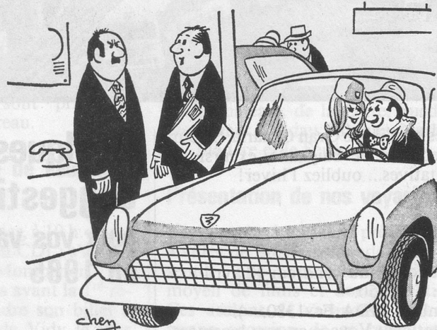
— C'est la meilleure vendeuse que nous ayons jamais eue. (Dessin de Chen-Cosmopress)

Personne ayant talents de décoratrice aimerait rencontrer un homme intéressé à créer 2 logements avec cachet dans village des Hauts du Léman. Ecrire sous chiffre 1630 «Aînés», Lausanne.