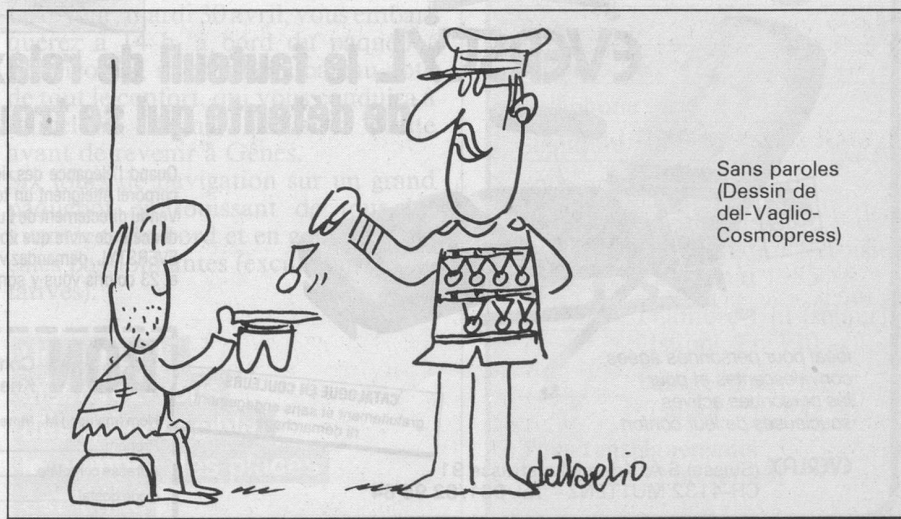
Sans paroles (Dessin de del-Vaglio- Cosmopress)

Avec ces changements, les banques suisses veulent faire de la carte eurochèque un «compte bancaire en poche».