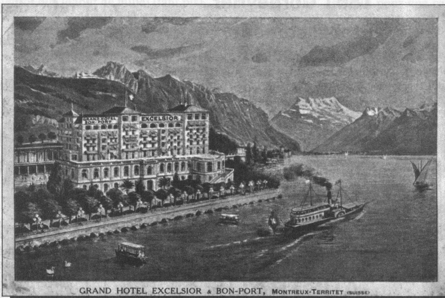
GRAND HOTEL EXCELSIOR & BON-PORT, MONTREUX-TERRITET (SUISSE)

Si nos aînés se rappellent parfaitement la vocation traditionnellement touristique d'innombrables stations romandes maintenant oubliées, les jeunes générations ne savent plus que des localités comme St-Cergue, Les Avants, Salvan, Evolène, Montbarry près de Bulle ou Chaumont, par exemple, attiraient d'innombrables étrangers et étaient équipées pour le tourisme, au début du siècle.