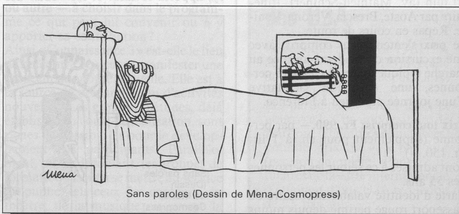
Sans paroles (Dessin de Mena-Cosmopress)