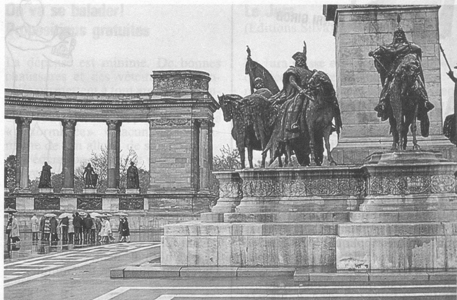
Le monument aux rois de Hongrie

Aujourd'hui ces souvenirs font rire. Il fut un temps où ils exprimaient le sérieux d'une situation. Par bonheur, la Hongrie ne connaît actuellement aucun souci alimentaire. Les magasins regorgent de très nombreux produits. Un certain desserrement dans les propositions économiques officielles amène un souffle d'air profitable à l'ensemble des habitants. Certes, les pensions des vieux demeurent insuffisantes; certes aussi, la Hongrie de 1986 a, en fin de compte, une bonne décennie de retard sur l'évolution en Occident. Néanmoins, certaines valeurs, certaines traditions que l'on ne cultive plus dans nos régions y sont encore en honneur. Le communisme continue à régner mais ses exigences sont loin d'être comparables à celles qui tou-