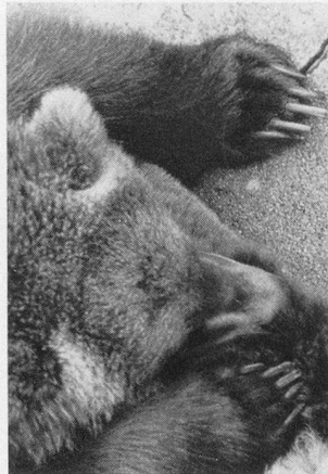
PLUMES, POILS & CIE

«LA POSTE DU GOTHARD», PAR RUDOLF KOLLER, 1874 PROPRIÉTÉ DU CRÉDIT SUISSE, ZURICH