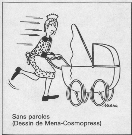
Sans paroles (Dessin de Mena-Cosmopress)

En principe, l'artériosclérose peut atteindre n'importe quelle artère, mais c'est au niveau du cœur que ses conséquences sont les plus graves: les lésions coronariennes représentent dans nos pays industrialisés la cause de