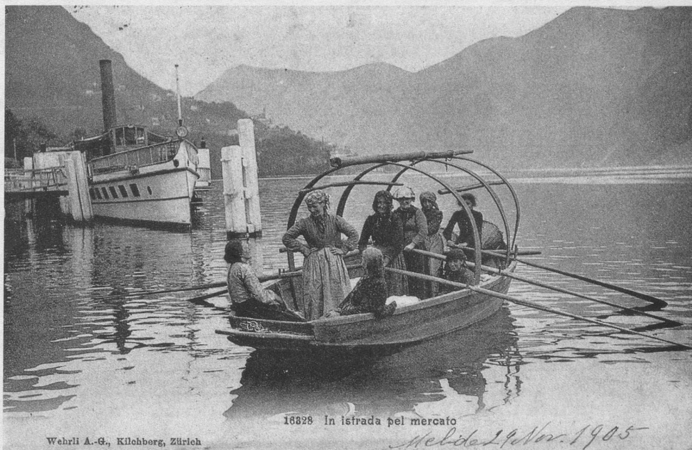
Wehrli A.-G., Kilohberg, Zürich

(Cartes extraites de la collection de J.-P. Cuendet, rue de la Gare, 1162 Saint-Prex.)