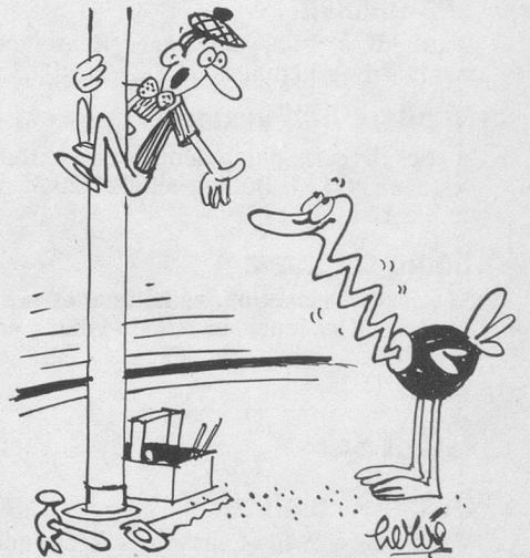
— J'ai dit: passe-moi simplement le mètre pliant! (Dessin de Hervé-Cosmopress)