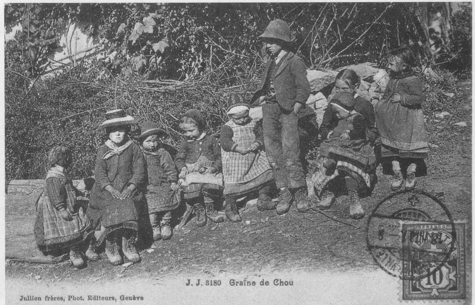
J. J. 8180 Graine de Chou

(Documents extraits de la collection de M. J.-P. Cuendet, rue de la Gare 1, 1162 Saint-Prex).