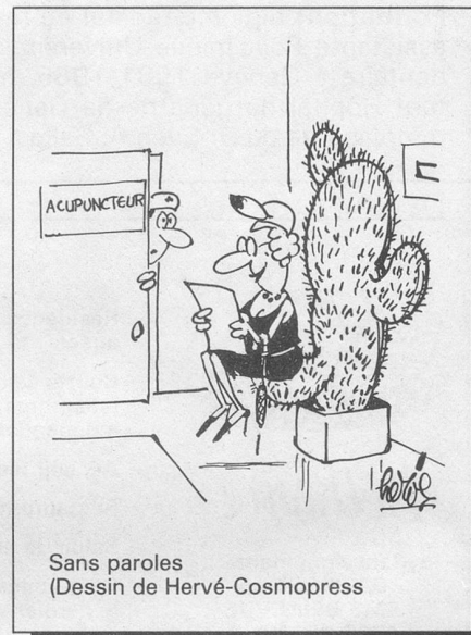
Sans paroles (Dessin de Hervé-Cosmopress)

Prix des deux volumes: Fr. 37.— + 800 points Mondo, ou en librairie: Fr. 86.— sans les points.