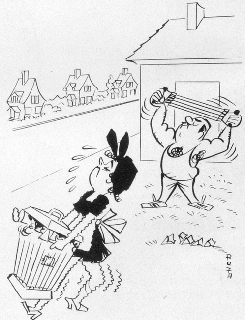
Sans paroles (Dessin de Rufa-Cosmopress)