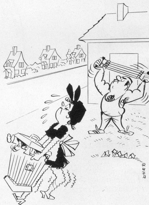
Sans paroles (Dessin de Rufa-Cosmopress)