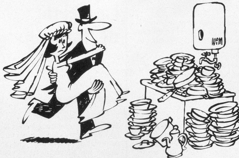
Sans paroles (Dessin de Moese-Cosmopress)