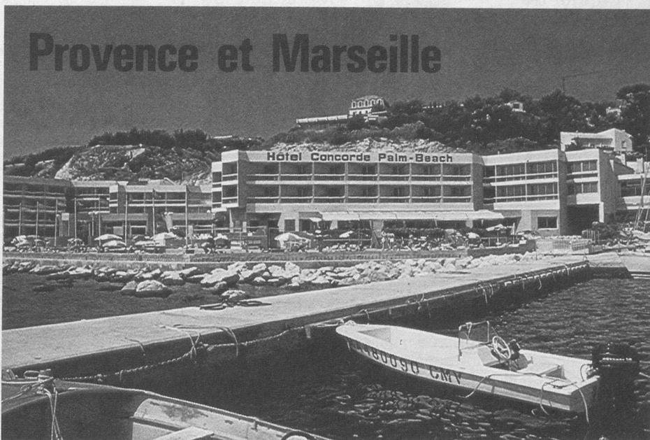
L'Hôtel Concorde-Palm Beach, à Marseille.