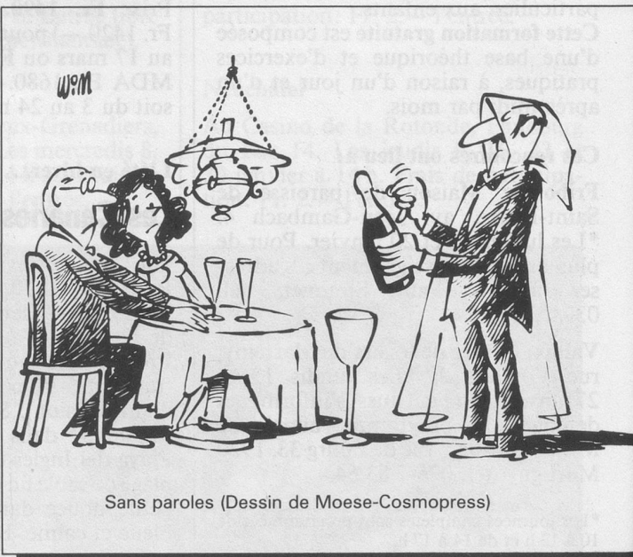
Sans paroles (Dessin de Moese-Cosmopress)

Monsieur 79 ans serait heureux de rencontrer dame 65-70 ans pour amitié et sorties, région Fribourg et environs. Ecrire sous chiffre 1747, «Aînés», Lausanne.