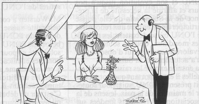
— Veuve Clicquot? — Non, c'est ma femme! (Dessin de Ramon Sabatès)

Réparations et révisions de pendules , morbières, pendulettes et montres anciennes. Devis gratuit, service à domicile. Horlogerie-Pendulerie de Chauderon, J.-L. Jobin. Tél. 021/24 40 94.