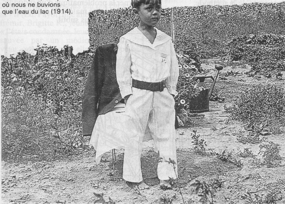
Saint-Sulpice, à l'époque où nous ne buvions que l'eau du lac (1914).

Dès lors, allez comprendre la logique de ce père qui ne voulait pas de fils musicien et qui ne trouvait rien de mieux que de lui faire donner, dès l'âge de 4 ou 5 ans, des leçons de solfège!