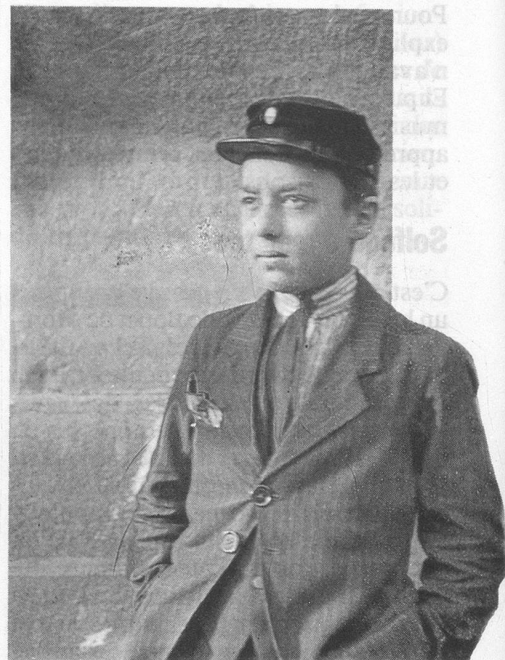
La casquette du Collège scientifique qui a tant amusé mes filles.

Et c'est dans ce temps-là que mon père, conforté en cela par mes résultats de collégien, décide, après une altercation atteignant le degré 6 de l'échelle de Richter, de m'inscrire à l'Ecole de