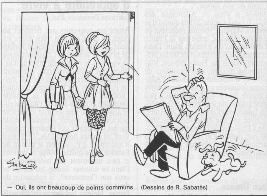
— Oui, ils ont beaucoup de points communs... (Dessins de R. Sabatès)