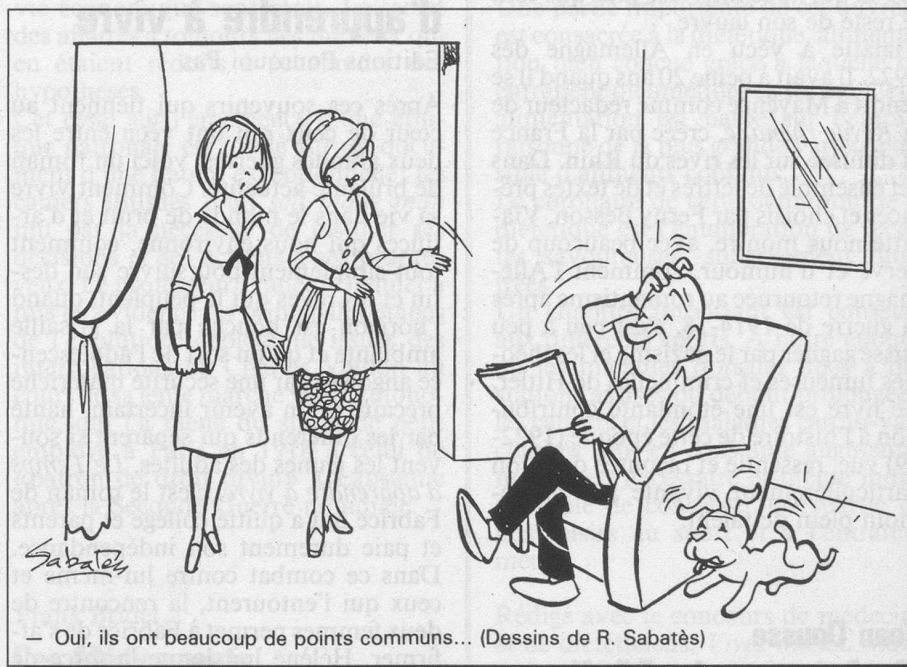
— Oui, ils ont beaucoup de points communs... (Dessins de R. Sabatès)