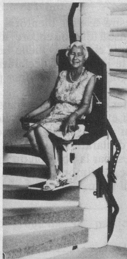
Modèle avec siège

Les monte-escaliers TLG Rigert pour escaliers larges ou étroits sur un ou plusieurs étages (fabrication suisse)