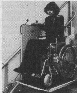
Modèle avec plateforme pour fauteuil roulant

Demandez-nous l'envoi d'une documentation illustrée gratuite. Mieux encore: la visite, sans engagement de votre part, d'un de nos techniciens qui vous conseillera utilement en fonction des lieux. Représentation et distribution exclusive pour la Suisse romande des monte-escaliers TLG Rigert