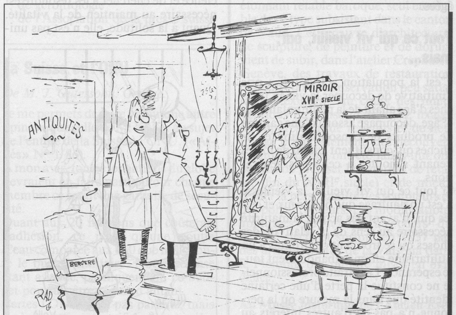
— Comme vous pouvez vous rendre compte, il est d'époque... (Dessin de Rad-Cosmopress)