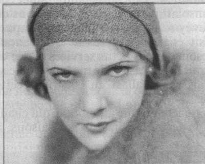
L'actrice Elissa Landi.