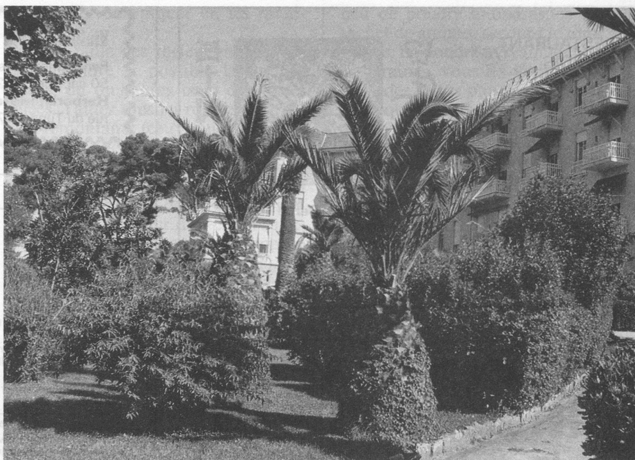
Le Grand-Hôtel, établissement de premier ordre.