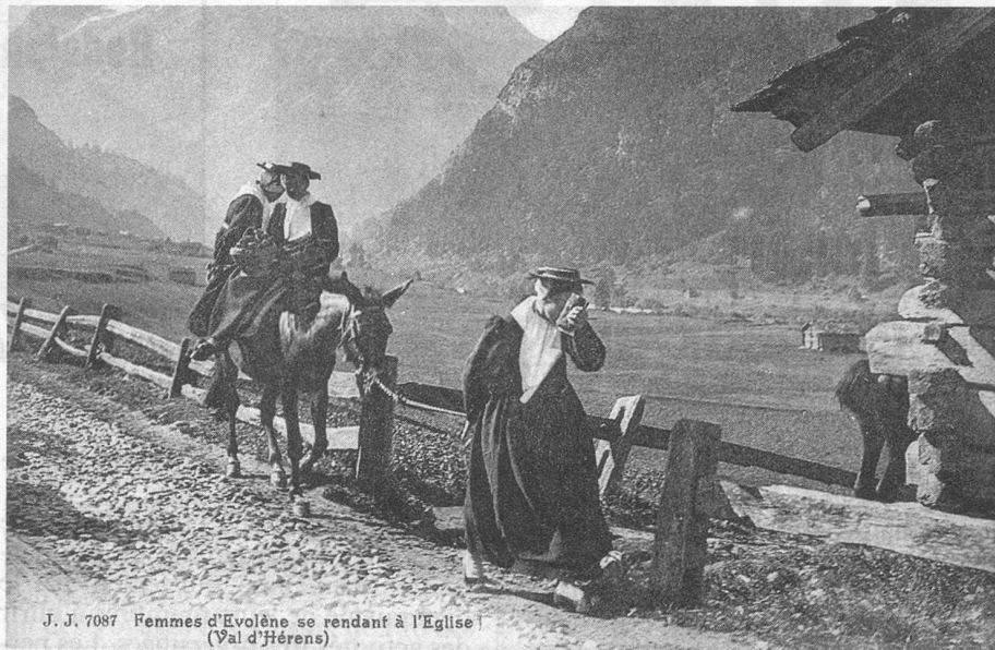
J. J. 7087 Femmes d'Evolène se rendant à l'Eglise (Val d'Hérens)

Notre clin d'œil de ce mois est destiné au Valais, pays merveilleux où la tradition a toujours été respectée avec ferveur et où, aujourd'hui encore, on constate facilement la survie des coutumes d'antan.