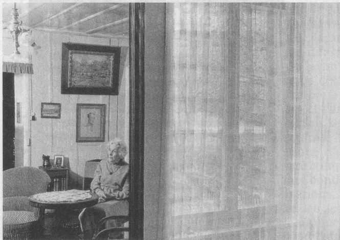
«La peinture m'a sauvée du désespoir...».