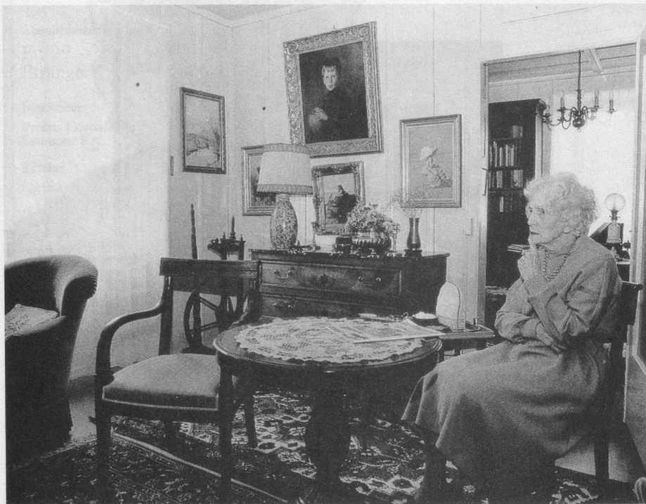
A Fenin, une charmante dame à cheveux blancs raconte sa vie...

que j'ai pensé à l'industrie, à la soierie, métier très florissant à l'époque. A 17 ans j'ai pris le train pour Lyon où mon père vivait une partie de l'année. J'ai eu la chance de trouver un foyer épatant, la Maison des Etudiants. Je me suis inscrite à l'Ecole des Beaux-Arts, section industrielle, et j'ai bien réussi le concours d'entrée et les examens après quatre années d'études. Mon père m'encourageait... Parmi mes camarades, il y avait le petit