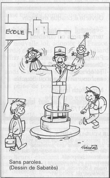
Sans paroles. (Dessin de Sabatès)

des maisonnettes séparées et où (ô merveille !) les chats et les petits chiens sont admis. Voilà qui est civilisé ! Aussi important que le cabinet de toilette personnel, une cuisinette pour chacun, même si elle ne consiste qu'en un frigo miniature et une plaque électrique. Qu'elle ait trente ans ou nonante ans, une femme a besoin de pouvoir se fricoter une petite soupe ou un oeuf au plat. La cuisine est le centre où la famille se réunit, le coeur de la maison. N'est-ce pas par une sorte de nostalgie pour des temps révolus que la vieille dame, désormais seule, ressent cet instinctif besoin de quelque endroit qui, même minuscule, lui donne l'illusion d'avoir encore un foyer ? Je le crois.