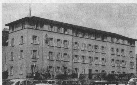
Le Grand Séminaire.

Le Grand Séminaire de Sion proche de l'évêché, qui a formé des générations de prêtres, est plus ou moins libre depuis le départ des séminaristes à Fribourg. Il abrite actuellement des réfugiés et des pensionnaires du Home Saint-Alexis. Depuis de longs mois, des consultations ont eu lieu auprès de différents organismes dont Pro Senectute, en vue de la création d'une Maison-Foyer, médicalisée, de 50 lits environ au Grand Séminaire. La commune de Sion, sur la base du rapport «Politique de la vieillesse», du mois de juin 1985, soutient cette initiative privée apportant une solu-