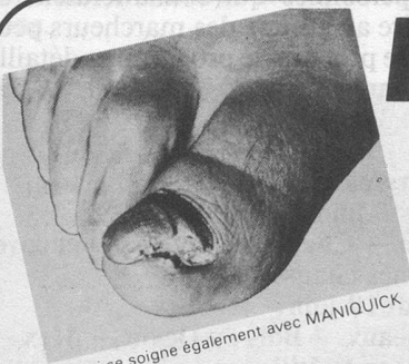
Ceci se soigne également avec MANIQUICK

L'AVLOCA (Association vaudoise des locataires) invite chacun, surtout les personnes âgées qui sont les plus concernées , à voter OUI à l'initiative «Impôt et Logement», les 28 et 29 juin prochains. Cette initiative est la seule solution qui leur assurera une importante réduction de leurs impôts.