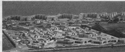
Port Barcarès: le village-vacances L'Estanyot

(Reprise après quelques années d'un séjour fort apprécié et de surcroît avantageux).