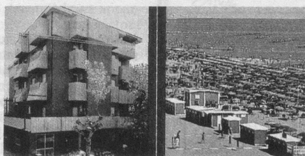
Rivabella: l'hôtel Carol et la plage.

Lieu de séjour très apprécié pour son hôtel à caractère familial et sa grande plage de sable descendant en pente douce dans une mer qui, à cette période de l'année, offre une température idéale.