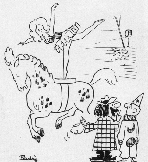
— Dis rien!... J'y fait croire qu'elle l'a oubliée! (Dessin de Padry-Cosmopress)