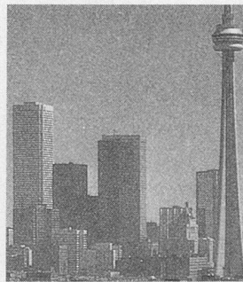
CONTE POUR UN ÉTÉ