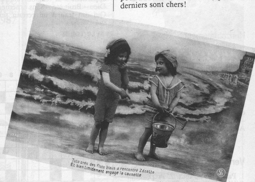
Toto près des flots bleus a rencontré Zézette Et bien timidement engagé la causette

Aujourd'hui, ce sont les marchands de tissus qui rient: moins ils en vendent pour les costumes de bain, plus ces derniers sont chers!