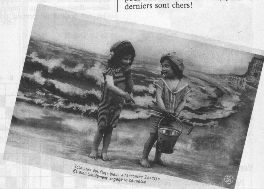
Toto près des flots bleus a rencontré Zézette Et bien timidement engagé la causette

Aujourd'hui, ce sont les marchands de tissus qui rient: moins ils en vendent pour les costumes de bain, plus ces derniers sont chers!