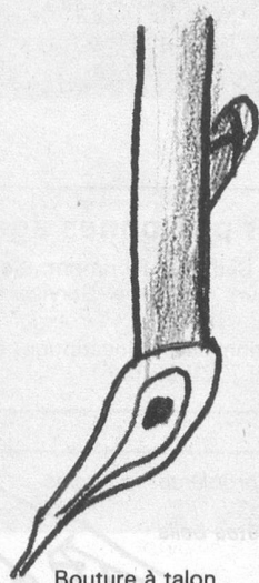
Bouture à talon

auparavant: fumier en granulé macéré dans de l'eau en égale quantité. Ajoutez 5 cm de tourbe, puis recommencez jusqu'à ce que le sac soit plein. Versez un arrosoir d'eau avant de refermer. Début décembre, vous pourrez utiliser ce compost aux pieds de vos rosiers. Si le gazon n'est pas entièrement décomposé, l'hiver se chargera de le défaire d'ici le printemps.