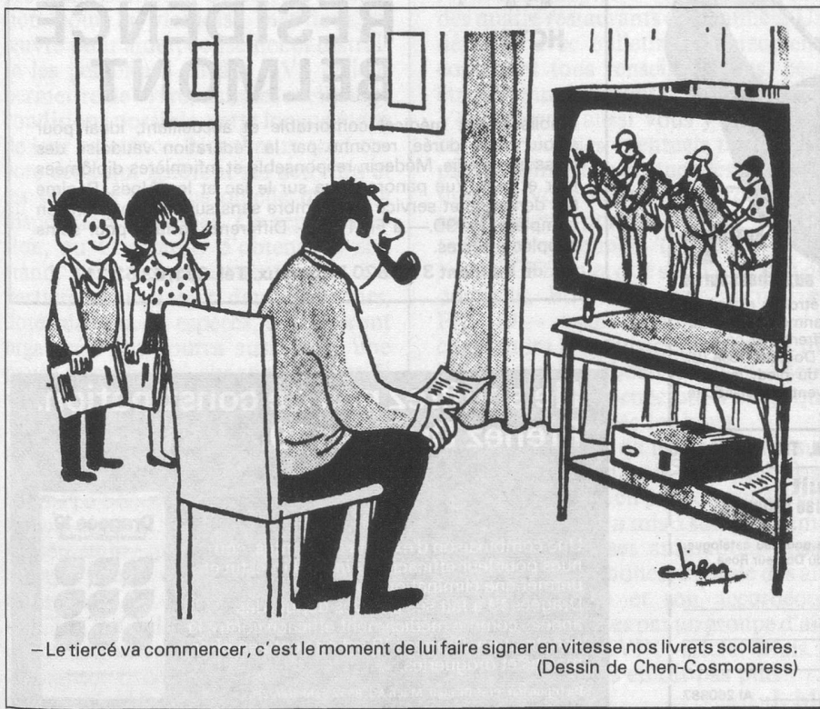
- Le tiercé va commencer, c'est le moment de lui faire signer en vitesse nos livrets scolaires. (Dessin de Chen-Cosmopress)

Le conseiller municipal directeur de la Sécurité sociale: J.-D. Cruchaud