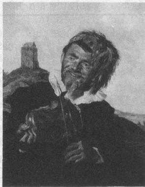
«Le violoneux» de Franz Haas; (Collection Thyssen).

«Debout, aux armes, pour la défense du pays. Rassemblez-vous autour de votre chef pour repousser l'ennemi! Dieu vous protège!» Ainsi cria l'Empereur dans sa proclamation.